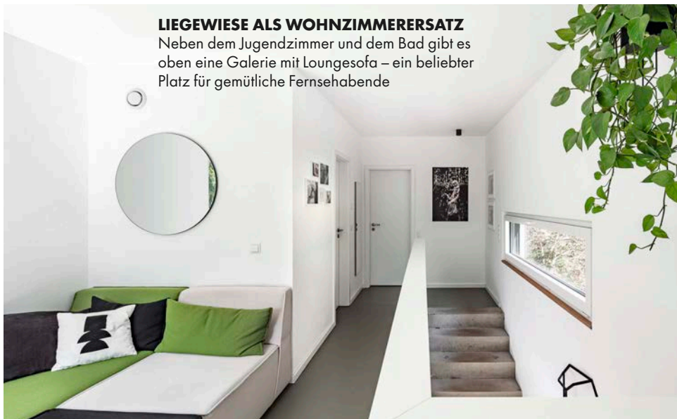
LIEGEWIESE ALS WOHNZIMMERERSATZ Neben dem Jugendzimmer und dem Bad gibt es oben eine Galerie mit Loungesofa – ein beliebter Platz für gemütliche Fernsehabende