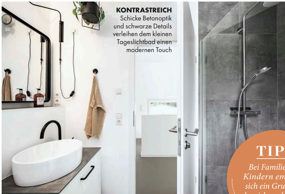
KONTRASTREICH Schicke Betonoptik und schwarze Details verleihen dem kleinen Tageslichtbad einen modernen Touch